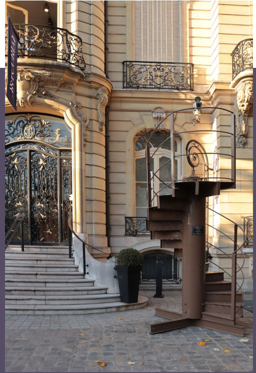
Lot n°33: Gustave EIFFEL, Escalier de la Tour Eiffel n° 17 - 1889, En fer forgé boulonné, Adjudé 274 475 € / 329 370 $ frais inclus le 1er décembre 2020 chez Artcurial

COMMUNIQUÉ DE PRESSE - L'ESCALIER DE LA TOUR EIFFEL VENDU AUX ENCHÈRES RÉSULTATS DE LA VENTE DU 1ER DÉCEMBRE 2020 À PARIS